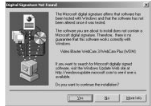
Kuva 1-4: Digital Signature Not Found -valintaikkuna.