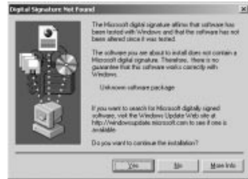
Kuva 1-3: Digital Signature Not Found -valintaikkuna.