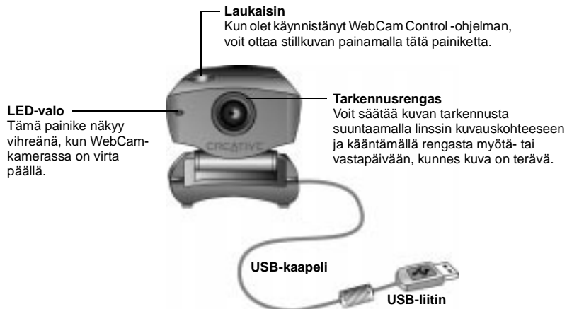
Kuva 1-1: WebCam Plus.

Kuva 1-1 esittää WebCam Plus -kameran ominaisuuudet.